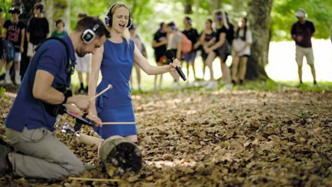
Entre art et science, un soundwalk pour remonter aux origines de la plus grande météorite jamais trouvée en Suisse.