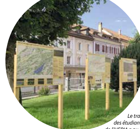
Le travail des étudiant-e-s de l'HEPIA a pu être valorisé via les panneaux installés à Tramelan, dans le cadre des « Traverses ».

Le Parc a collaboré durant l'année académique 2021-2022 avec l'atelier d'approfondissement du projet de paysage, un master conjoint HES-SO-UNIGE-HEPIA. Le temps d'un semestre, les étudiant-e-s ont analysé les éléments composant le paysage de Tramelan et son rôle dans la planification territoriale. Les résultats ont été présentés in situ, au travers d'une exposition au cœur du village. Les travaux ont abordé quatre thématiques centrales pour l'avenir de Tramelan : la qualité et l'ambiance paysagère des espaces non construits et des jardins, l'évolution du village en lien avec la densification vers l'intérieur, les enjeux liés au ruissellement des eaux et à l'imperméabilité des sols et, enfin, la couverture végétale de la localité en comparaison avec celle du Parc dans le contexte du changement climatique.