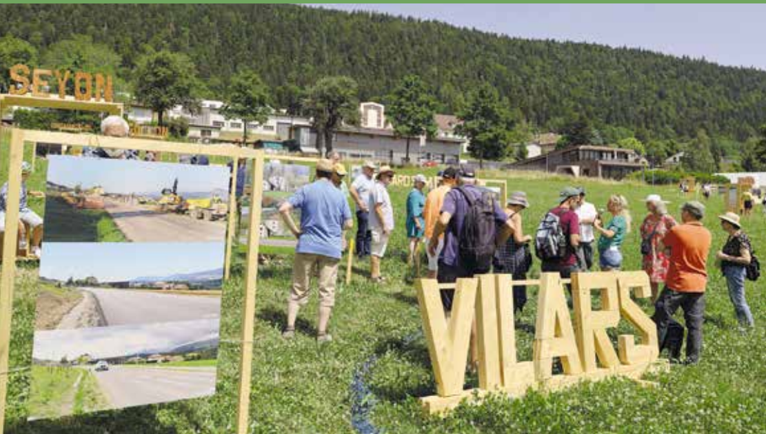
L'expo « Le paysage dans tous ses états » a été organisée pour célébrer le « Prix Paysage » attribué pour la 1 re fois à un parc naturel régional.

UN PATRIMOINE VALORISÉ, DES PAYSAGES VIVANTS