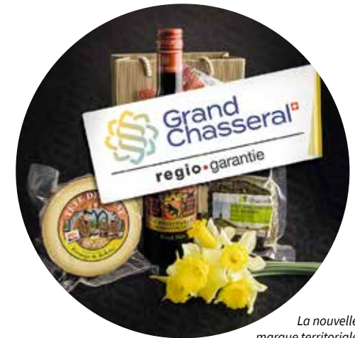
La nouvelle marque territoriale Grand Chasseral ornera désormais les étiquettes des produits du terroir du Jura bernois.

La nouvelle marque territoriale Grand Chasseral a été dévoilée à fin 2022. Outil promotionnel de notre région, elle émane de la Fondation pour le rayonnement du Jura bernois, dont le Parc est membre fondateur aux côtés de la CEP, de la Chambre d'agriculture, de Jura bernois.Bienne, de JbT et de fOrum Culture. Le Parc a participé tout au long de 2022 à la planification de la restauration du bâtiment de La Couronne, à Sonceboz-Sombeval, qui constituera dès septembre 2023 l'épicentre de la promotion du Jura bernois. La Couronne réunira un espace de valorisation de l'économie régionale, une boutique, une salle d'événements, une centrale d'accueil et de réservations touristiques, un coin café et une galerie destinée à la culture. Elle sera par ailleurs le siège de plusieurs institutions régionales.