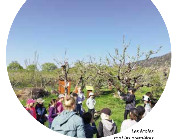
Les écoles sont les premières à profiter du renforcement de la collaboration avec Evologia, démarrée en 2022.

Une nouvelle collaboration entre Evologia et le Parc Chasseral a commencé en 2022 afin d'étoffer les offres de découverte du site pour les classes, les familles et les groupes d'adultes. Une nouvelle animation pédagogique guidée sur le thème du verger en permaculture a été créée pour les classes primaires afin de sensibiliser les élèves aux enjeux de la biodiversité dans les jardins. Les familles, quant à elles, sont invitées à découvrir les richesses des jardins extraordinaires sous forme de jeux de pistes. Le Parc Chasseral a apporté son soutien pendant toute l'année pour l'élaboration de ces offres, la formation des guides et le suivi de la qualité. La collaboration va se poursuivre en 2023, notamment avec une proposition de sortie guidée pour les entreprises et autres groupes d'adultes.