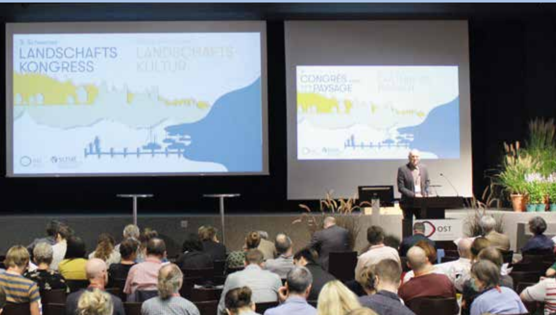
Après une 3 e édition à Rapperswil en 2022, le prochain Congrès suisse du Paysage se tiendra à Tramelan en septembre 2024.

UNE RECHERCHE POUR DES ACTIONS BIEN CIBLÉES