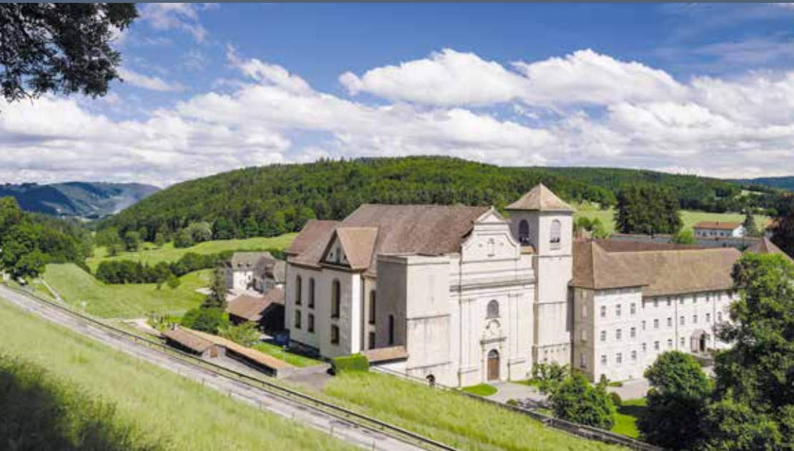
La commune de Saicourt, avec son site de Bellelay, pourrait rejoindre le Parc dès 2025 avec six autres communes situées à l'est du territoire actuel.

UNE ORGANISATION EFFICACE INTÉGRÉE À LA RÉGION