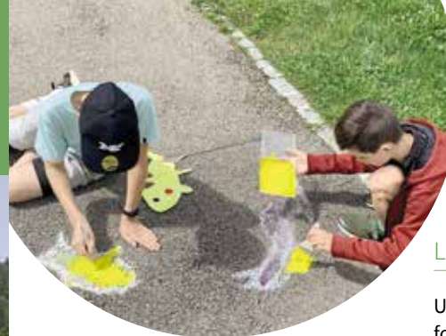
Un atelier scolaire a permis de réaliser deux fresques au sol sur deux traverses particulièrement fréquentées par les élèves.

Suite à un appel à projets, la commune de Péry-La Heutte s'est portée acquéreur du pavillon en bois imaginé en 2019 par les étudiant·e·s de l'école d'architecture de Berthoud, monté dans un premier temps à Nods. Installé tout début 2023 sur le site de l'ancienne école de La Heutte, le pavillon est intégré à un projet de chemin didactique réalisé par Pro Natura. Une nouvelle vie au bénéfice de la sensibilisation à la biodiversité.